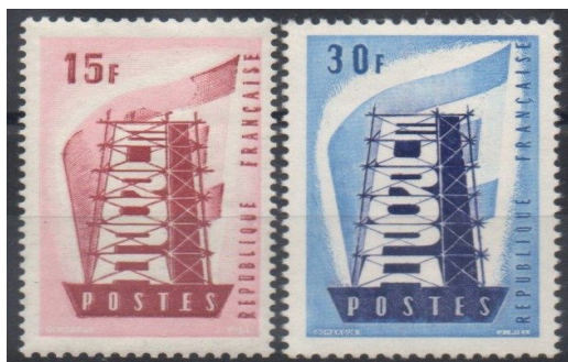
1956 première émission des timbres Europa

Le 9 mai 2023, La Poste émet un timbre de la série EUROPA sur le thème « La Paix : la valeur humaine la plus importante », illustré par une œuvre de Linda BOS et Runa EGILSDOTTIR.