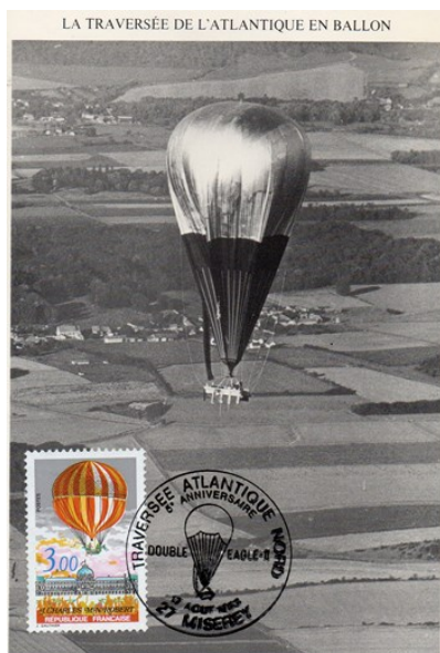
Le "Double Eagle II" dans le ciel de France peu avant son atterrissage.

Me voilà détective de l'histoire pour retrouver la trace de cet événement qui justifie l'édition d'enveloppes commémoratives et d'une carte maximum.